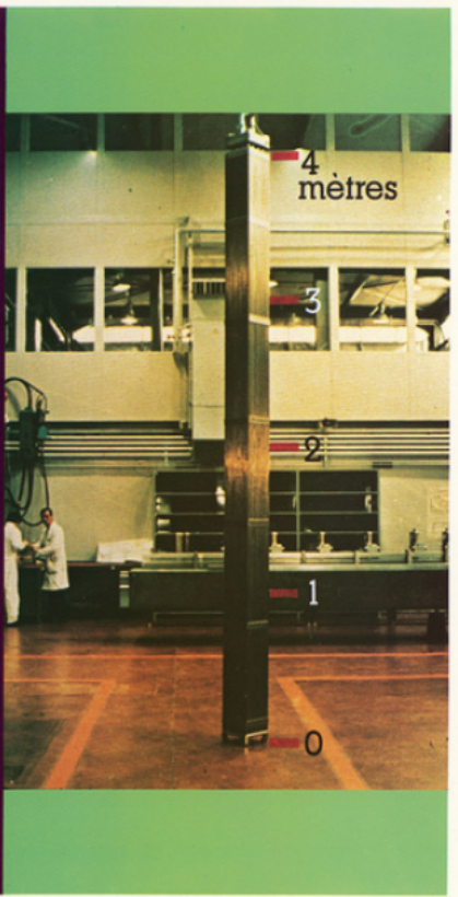
LE FLEUVE - PARIS