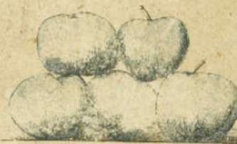
Plantation des arbres

Les pommes ne doivent jamais être laissées à la pluie ou à l'humidité; elles perdraient de leur suc et fourniraient un cidre moins abondant et moins alcoolique.