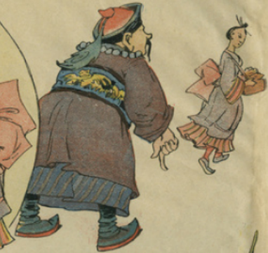
Très gourmand des œufs d'hirondelles, le mandarin voulut goûter à ce mets délicat, malgré le refus de la jeune marchande.