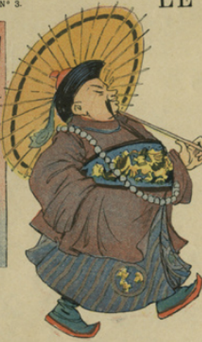
Tehi-Chung-Lang, riche mandarin, se promenait aux environs de Pékin.