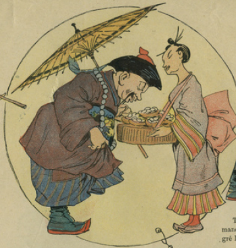
Quand il rencontra une jeune Chinoise portant des nids d'hirondelles destinés à l'empereur.