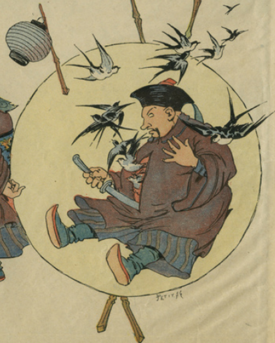
La sentence fut exécutée séance tenante. Mais les œufs étant éclos, les spectateurs virent avec étonnement s'échapper du ventre du supplicié une volée d'hirondelles.