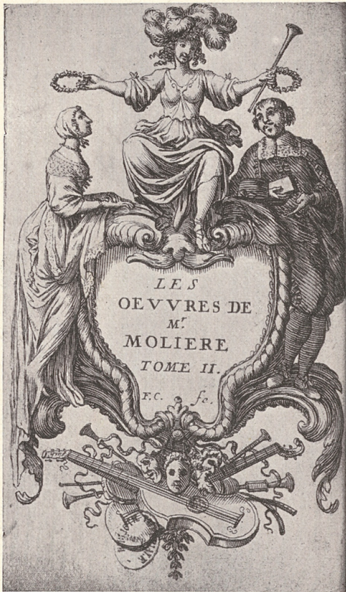
1. Molière dans un rôle de bourgeois (d'après F. Chauveau).

On n'a pas de document contemporain représentant Molière dans Chrysale; mais le costume de Molière dans le rôle d'Arnolphe peut sans doute donner quelque idée de son costume dans les rôles bourgeois. D'ailleurs le costume de Chrysale était ainsi composé : « justaucorps et haut-de-chausses de velours noir, veste de gaze violette et or garnie de boutons, un cordon d'or, jarretières, aiguillettes et gants ».