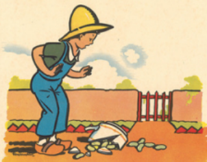
ré mi ca sse sa ta sse