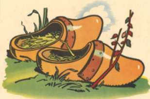
les sa bois de pa pa