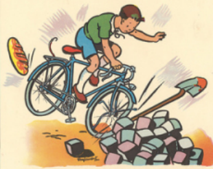
ré mi n'a pas vu le tas de pa vés