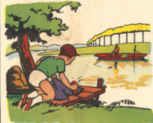
ré mi à la ri vi è re la ve la cu lo ite