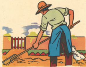
pa pa ra ti sse