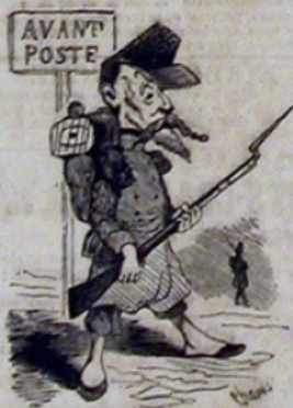
Une très position.