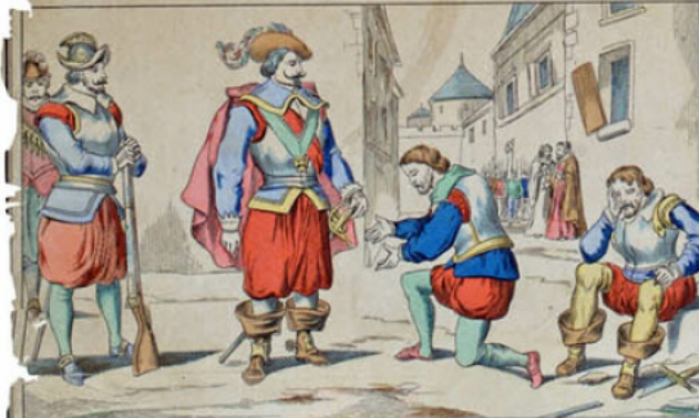
Capitulation de La Rochelle