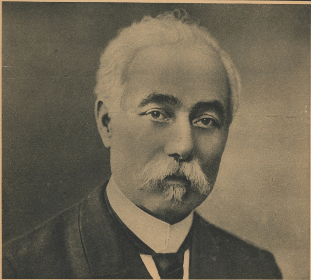
M. Bigourdan, le grand astronome français