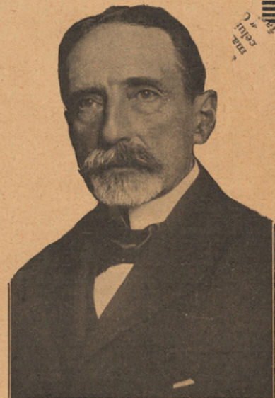
M. LE PROFESSEUR TUFFIER, Membre de l'Académie de médecine.

CHACUN sait que le D r Tuffier est l'une des gloires de la chirurgie française. Mais, chez ce grand savant et ce grand praticien, comme chez toutes les personnalités vraiment supérieures,