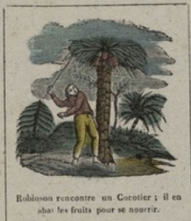
Robinson rencontre un Coarotier; il en abat les fruits pour se nourrir.