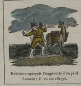
Robinson aperçoit l'empreinte d'un pied humain; il en est effrayé.