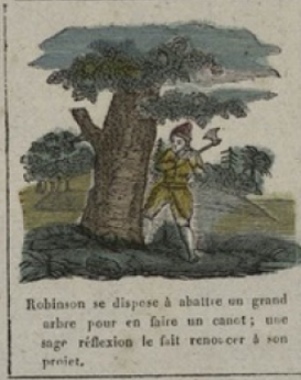
Robinson se dispose à abattre un grand arbre pour en faire un canot; une sage réflexion le fait renouer à son projet.