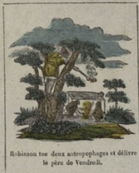
Robinson tue deux antropophages et délire le père de Vendredi.