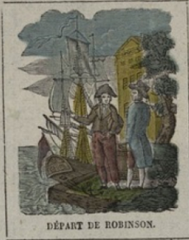
DÉPART DE ROBINSON.