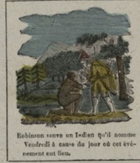
Robinson sauve un Indien qu'il nomme Vendredi à cause du jour où cet événement eut lieu.