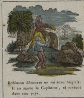
Robinson découvre un vaisseau Anglais. Il en sauve le Capitaine, et revient dans son pays.