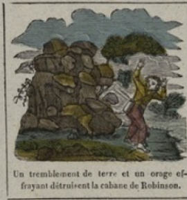
Un tremblement de terre et un orage effrayant détruisent la cabane de Robinson.