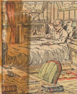
Un beau matin, à son réveil, il trouva dans son étui à lunettes...