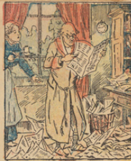
Furieux et décoiffé il rentre au logis, malade, et parcourt les journaux arrivés en son absence.