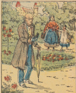
Un vieux savant retiré à la campagne suscitait les rires des honnêtes villageois, tant il était distrait et uniquement plongé dans ses études linguistiques.