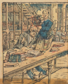
Et se rend directement à la Bibliothèque Nationale dont il consulte les plus poudreux volumes, mais sans succès.