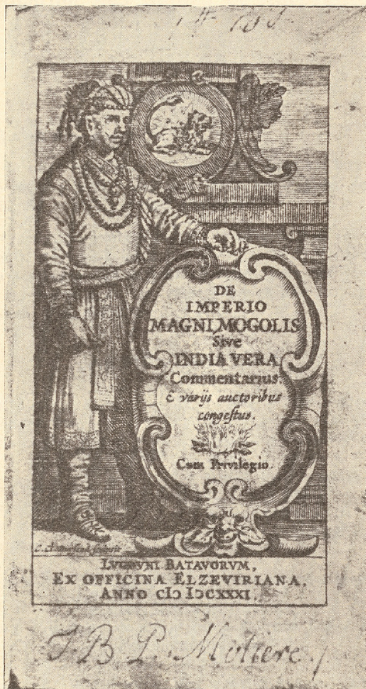
FIG. 2. — Signature autographe de Molière.