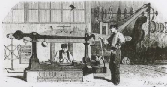
Machine à éprouver la résistance des tôles.

le N° de l'illus- du 18 janvier r, nous avons par- première partie travail sur les Établissements Marine impériale. Circumstances im- s nous ont obli- gés de reporter l'appar- la suite de cette en la reprenant l'Etat, nous prions votre dévoué repou- sant le premier ar- tisanat l'histo- re de la fan- des agrat-ils