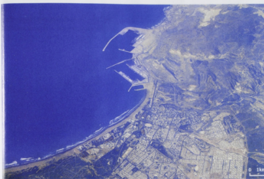
2 Agadir (Maroc).