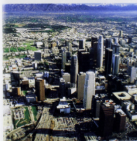
3 Los Angeles (États-Unis).