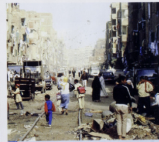
4 Le Caire (Égypte).