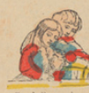
Zeepbellen maken. Faire des bulles de savon.