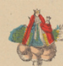
O. L. Vrouw. Sainte Vierge.