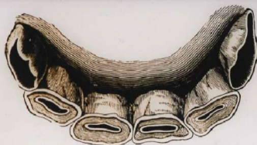
Fig. 124. — Mâchoire d'un Cheval de cinq ans.