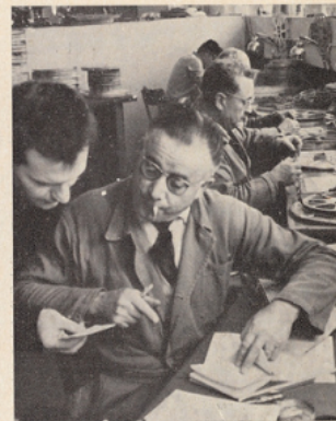
Atelier de vérification des films.