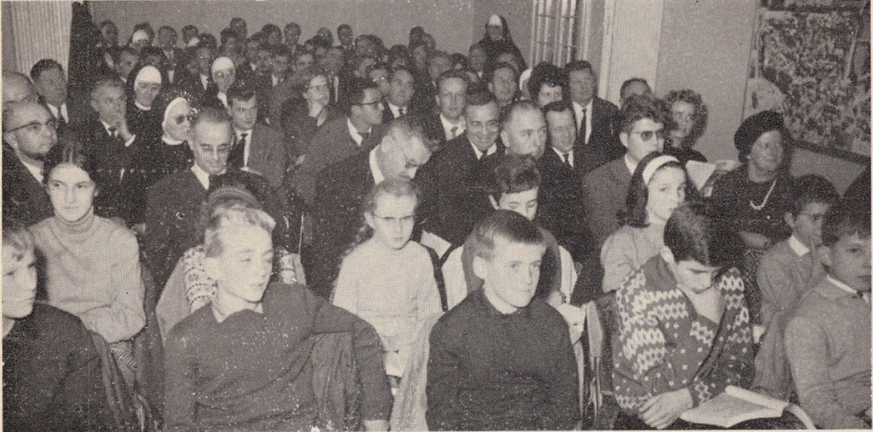
Au premier plan, les élèves du Lycée de Saverne.

Conformément à la circulaire ministérielle n° 64-373 du 5 octobre 1964, une journée d'information de la radio-télévision scolaire a eu lieu au C.R.D.P., le 4 novembre 1964, sous la présidence de M. l'Inspecteur Général HOLDERITH et avec la participation de MM. CORMARY et GAUDU, de l'Institut Pédagogique National, ainsi que de M. ECKERT et les membres de l'Equipe de Production des Emissions de Radio d'allemand. Nombre de participants : 71, dont 2 inspecteurs des Enseignements élémentaire et complémen-