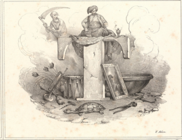
A Paris, chez Assolant, par J.J. Rousseau, n° 70