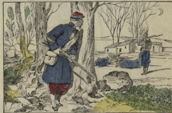
Le sergent Hoff qui se plaçant en embuscade a tué à lui seul plus de cinquante ennemis.