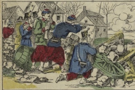
Défense héroïque des habitants de Châteaudun.