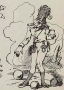
Frappé par les mitrs, battu par les Français, décidément j'ai pas de chance!