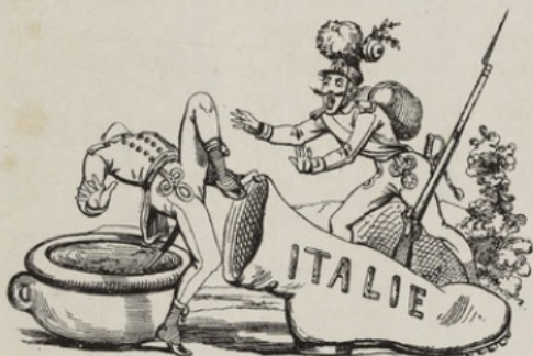
Quitte précipitamment sa botte, il tombe dans le Pô.