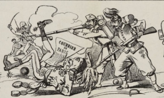
Sapristi...! Les journaux français sont bien informés; les nouvelles nous arrivent en même temps que les événements.