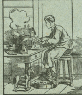
LA COLLE FORTE