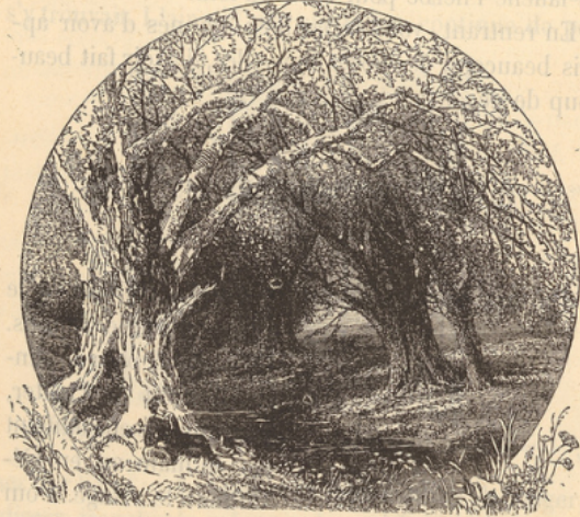
Ruisseau dans le bois.

Arrivés au bout de la plaine, nous commencerons à descendre vers la rivière. Le terrain est en pente de chaque côté de l'eau. Ce terrain en pente douce, au fond duquel coule un ruisseau, une rivière, un fleuve, s'appelle val , vallon ou vallée .