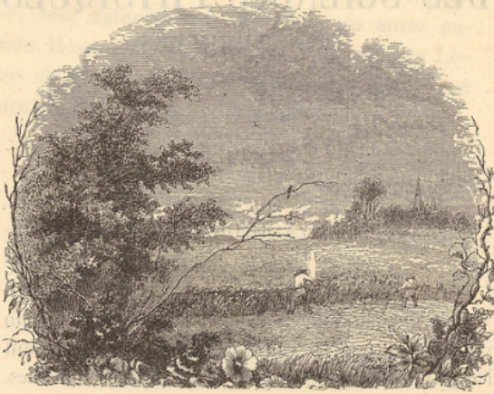
Le champ de blé.

sont en réalité bombées . Voilà pourquoi, en