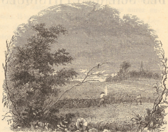
Le champ de blé.

sont en réalité bombées . Voilà pourquoi, en