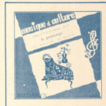
Sonate du Printemps (Beethoven) ■ M C - 3003