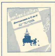
Divertissement en ré (Mozart) ■ M C - 2502