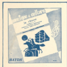
La Chasse (Haydn) ■ M C - 3001