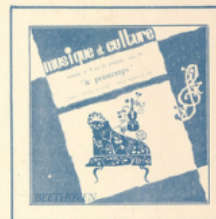
Sonate du Printemps (Beethoven) ■ M C - 3003