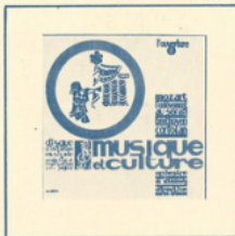
M. C. 3005