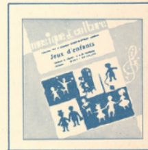
Jeux d'enfants (Bizet) ■ M C - 2503