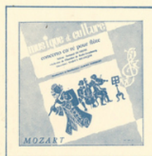
Concerto pour flûte (Mozart) ■ M C - 3002