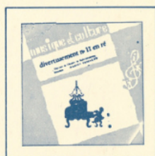
Divertissement en ré (Mozart) ■ M C - 2502