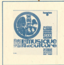
M. C. 3006