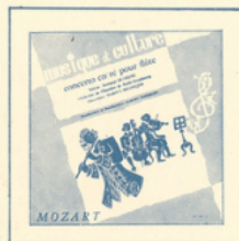
Concerto pour flûte (Mozart) ■ M C - 3002