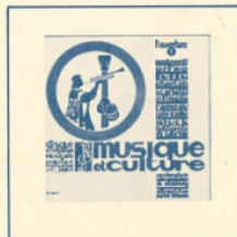
M C - 3004