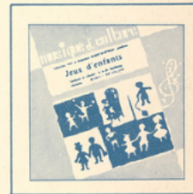
Jeux d'enfants (Bizet) ■ M C - 2503