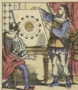
C'est en 1500 que le célèbre SYSTÈME DE COPERNIC bouleversa toutes les connaissances astronomiques alors connues, en plaçant le soleil comme centre de l'univers, autour duquel la Terre tourne en 365 jours, animée d'un mouvement de rotation sur elle-même.