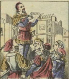
En 1563, les Vénitiens publièrent leur premier journal appelé Notizie Seritte , qu'on pouvait acheter pour une minime pièce de monnaie appelée gazetta. Cette petite monnaie donna son nom au journal, et celui-ci prit alors le nom populaire de GAZETTE qui lui est longtemps resté.