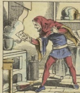
L'ÉTAMAGE DES GLACES date de l'année 1346. Un savant inconnu découvrit la propriété de l' Amalgame d'Étain (composé d'Étain et de Mercure) et eut l'idée de l'appliquer au dos d'une feuille de verre. Les anciens se servaient de miroirs d'argent ou d'acier poli.