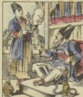
Le CAFÉ est originaire de la Perse. Lorsque Sélim, en 1517, conquiert l'Égypte, l'usage du Café passa à Constantinople. Introduit en Italie en 1645, et en Angleterre sous Charles II en 1652, il fit son apparition en France en 1665. À cette époque le livre de Café valait 40 écus.