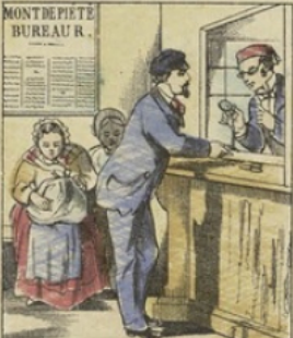
Le premier MONT DE PIÉTÉ fut fondé au XV e siècle, à Pérouse en Italie. À la suite de prédications charitables d'un religieux Riccollet, le Père Bernabè de Terni. Ces établissements créés pour prêter gratuitement sur gages, se furent introduits en France qu'au XVIII e siècle.