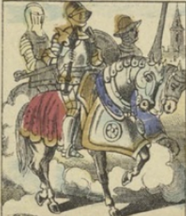
Les ARMURES de guerre sont, comme la guerre elle-même, aussi anciennes que l'homme. La cotte de mailles et le haubert ont été empruntés aux musulmans à l'époque des croisades. Les armures d'acier ont été en usage jusqu'au XVI e siècle où la poudre à canon les a rendues inutiles.