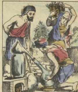
L'ALCOOL, dont le nom veut dire en Arabe «essence subtilisée», a été découvert suivant la tradition en 824 par l'arabe Rhazès. Un savant médecin et alchimiste du XIII e siècle, Arnaud de Villeneuve, l'introduisit en Europe et en fit connaître les propriétés.