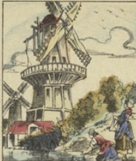
Les MOULINS À VENT sont d'origine orientale. Nous en devons l'importation aux croisés, vers 1040 ou 1050. Dans quelques pays on les appelle même turquois, à cause de leur origine. On pense qu'ils ont été, dès 718, employés en Bohême. C'est en Hollande qu'on en voit aujourd'hui le plus.