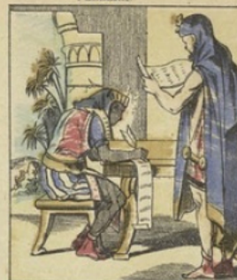
Le PAPIER, chez les anciens Égyptiens, était fabriqué avec la pâte d'un roseau appelé papyrus. Le papier de coton ou de soie fut importé en 750 à Constantinople: le papier de toile date du XIII e siècle. C'est vers 1150 que les premières fabriques de papier de chiffons furent créées en Espagne.