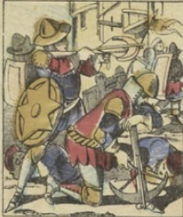
L'emploi de l'ARBALETTE dans les armées date du XI e siècle: ce fut un grand progrès militaire. Proscrite en 1190, par le 2 e concile de Latran, comme trop meurtrière, elle fut abandonnée en France, mais adoptée en Angleterre par Richard Cœur-de-Lion. Philippe-Auguste en rétablit l'usage en France et, grâce à elle, gagna la bataille de Bouvines (1214).