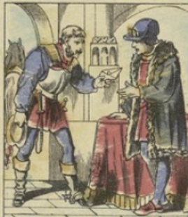
Le service des POSTES fut établi par Louis XI, dans l'édit de Doullens, à l'occasion du siège de Namur, en 1464. Ce service était pour l'usage particulier du roi. En 1576, Henri III en rendit l'usage public. Les Messageries furent établies en 1567 sous Henri IV, et c'est en 1627 qu'on établit pour la première fois la taxe des lettres.