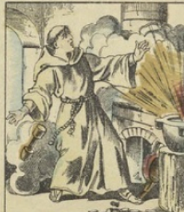
Le POUVRE À CANON a été connu des Chinois dès la plus haute antiquité. Les Romains employaient le feu grégeois: mais la poudre véritable ne fut connue en Europe qu'en 1284. On attribue cette invention à Roger Bacon, à Schwarz et aussi à Albert le Grand.