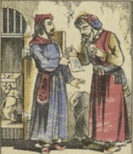
C'est au XII e siècle que les Juifs chassés de France et réfugiés en Lombardie, inventèrent la LETTRE DE CHANGE, le plus bel instrument de commerce et de crédit qui ait été jamais imaginé. La lettre de change permettait aux Juifs de laisser à l'abri leurs richesses métalliques. Les négociants Lyonnais furent les premiers à l'adopter.