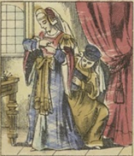
L'origine des ÉPINGLES remonte en France au commencement du XV e siècle. Autrefois on se servait de cordons, d'aiguillettes d'ivoire ou de simples épingles. C'est Catherine Howard, la cinquième femme de Henri VIII qui, en 1542, introduisit l'usage des épingles en Angleterre.