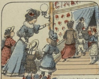
Dans un coin bien connu de Paris il existe un cinématographe, où les parents vont conduire leurs enfants, lorsqu'ils ont des défauts dont ils ne veulent pas se corriger. Là les enfants voient, pendant plusieurs jours, défiler des images où chacun d'eux peut se retrouver.

CONTES NOUVEAUX HISTOIRES CHOISIES Planche n° 46