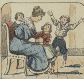
Après ces humiliantes séances, les enfants sortent corrigés. Ils rentrent chez leurs parents, confus et repentants, et il est bien rare qu'ils s'exposent jamais à retourner aux représentations du cinématographe.