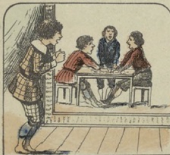
Albert, le jeune égoïste, pleure de rage, à la vue de ces avares, couvrant leurs trésors de leurs mains avides, et se refusant à tout partage.