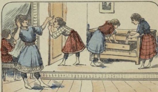
Et c'est pour la curieuse Denise que se montrent ces petites filles écoutant aux portes ou ouvrant les tiroirs, les paquets, et ne tiennent pas compte des observations.