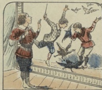
Et Richard, le cruel, se reconnaît dans ces enfants qui maltraitent les animaux les plus inoffensifs ou les enfants plus faible qu'eux.