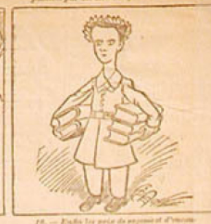
16. — Enfin les prix de sciences et d'arts. Le jeune Ernest reçoit le 1 er prix de physique. (Le monde des rois, 2 e édition.) Le jeune Paul reçoit le 1 er prix de chimie. (Le monde des rois, 2 e édition.) Le jeune Louis reçoit le 1 er prix de dessin. (Album de Perrotin les Vingt Millions.)