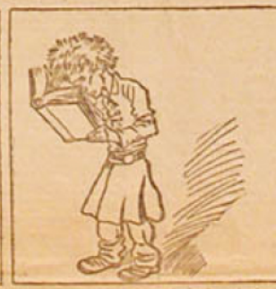
11. — Au jeune Auguste le 1 er prix de chimie. (Traité des explosifs, avec corrigé en effet par M. Turpin.)