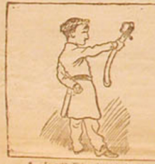
9. — Le petit Victor obtient le 1 er prix d'histoire. (En suite d'honneur.)