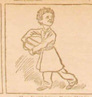
14. — Au petit Gaston, 1 er prix d'histoire. (Le monde des rois, 2 e édition.)