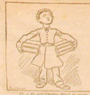
13. — Au petit Charles, élève du maître, le 1 er prix de philosophie. (Le capitaine de la République.)