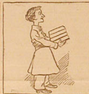
6. — On procède ensuite à la distribution des récompenses. Au jeune Maurice, six d'uns de plus de nombre, est décerné le 1 er prix de calcul. (Histoire du financier Law.)