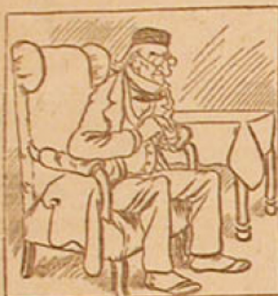
1. — M. Pédaloup, chef d'une grande association laïque, veut donner, cette année, à la distribution des prix, un air d'acceptation.