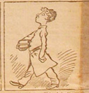
12. — Au jeune Michel, le 1 er prix de dictionnaire français. (Œuvres de Quinault, publiées par M. Bismarck.)