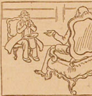
2. — Le ministre la printéria!