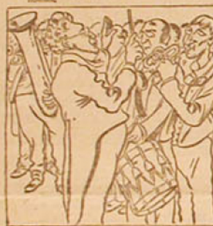
5. — L'orphelin des anciens élèves entonne le Marseillais, pour le Chant du Départ.