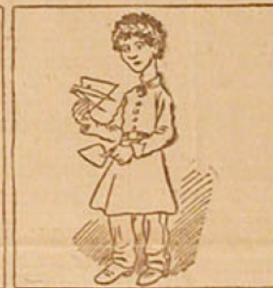
7. — Petit Félix Tux reçoit le 1 er prix d'industrie nationale, lequel consiste en une broche, une épave et un coup de griffe par la Luge de l'Assiette.