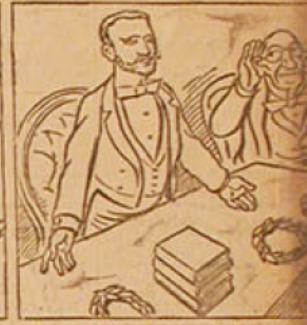
4. — M. le ministre rigole qu'il a voulu montrer qu'il n'est pas un homme à l'égard de cette belle jeunesse, mais ce soir, la France de demain! (Bravo.)