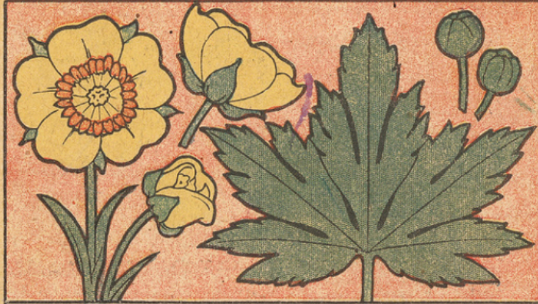
ÉLÉMENT DÉCORATIF BOUTON D'OR

2 e EXERCICE - BORDURE - Feuilles - Boutons