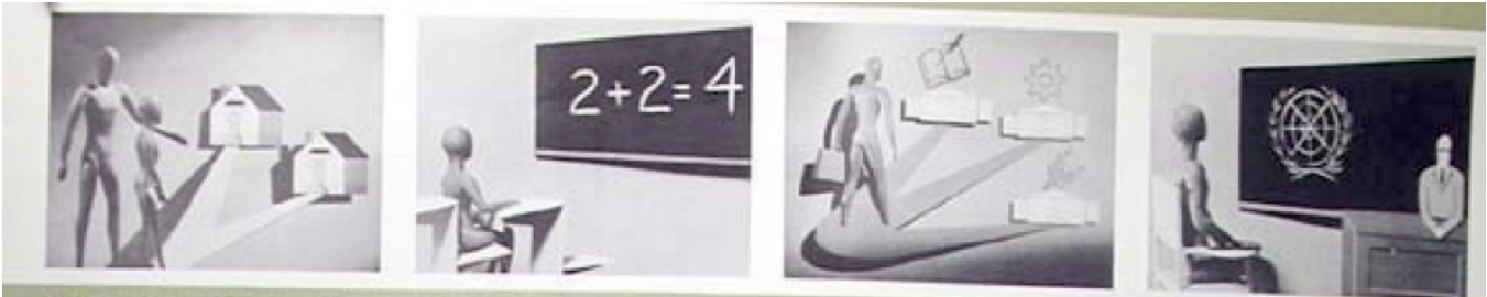
11 Tous les hommes naissent à l'état de liberté et d'égalité de droits. Ils sont doués de raison et de conscience et se doivent de vivre en harmonie avec les autres. 12 Tous les hommes ont droit à l'éducation élémentaire gratuite. On ne peut refuser à personne l'accès à l'éducation. 13 Chacun a des devoirs. L'accomplissement de ces devoirs est une condition de la liberté. Ceux-ci se doivent d'être exercés dans le respect des droits des autres. 14 L'individu doit être traité avec dignité. Les droits de responsabilité de l'individu sont de nature civile, politique, économique, sociale et culturelle. Ils sont de nature humaine et doivent être exercés dans le respect des droits des autres.