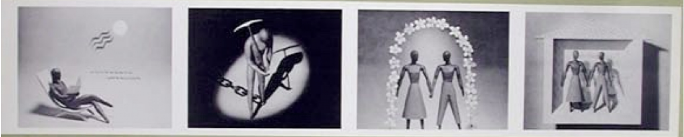
19 Tous les hommes ont le droit à un procès équitable et public. Ils ont le droit à un procès équitable et public. 20 Tout le monde a droit au mariage et au mariage est une union libre et volontaire. 21 Le mariage est la base de la famille. La famille est l'élément naturel de la société et a le droit de la protection de la loi. Le mariage est la base de la famille et a le droit de la protection de la loi. 22 Le droit de propriété est un droit naturel. Il est le droit de propriété.