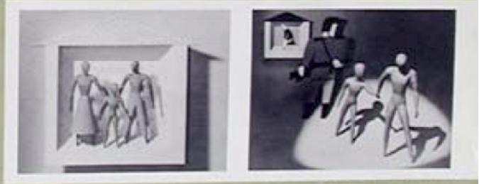
23 Tous les hommes ont le droit de librement aller et venir dans n'importe quel pays. Ils ont le droit de librement aller et venir dans n'importe quel pays. 24 Toute personne a le droit de chercher et d'obtenir l'asile dans un autre pays.