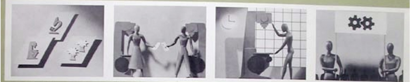
15 Il est le droit de tous les hommes de travailler. Le chômage constitue une violation de ce droit. On doit donc chercher à éviter le chômage et à assurer à tous les hommes le droit de travailler. 16 Tous les hommes ont le droit de travailler dans des conditions de travail justes et favorables. Ils ont le droit de travailler dans des conditions de travail justes et favorables. 17 Tous les hommes ont le droit de former et de rejoindre librement des syndicats pour défendre leurs intérêts. 18 Tous les hommes ont le droit de participer librement à la vie culturelle de leur pays.