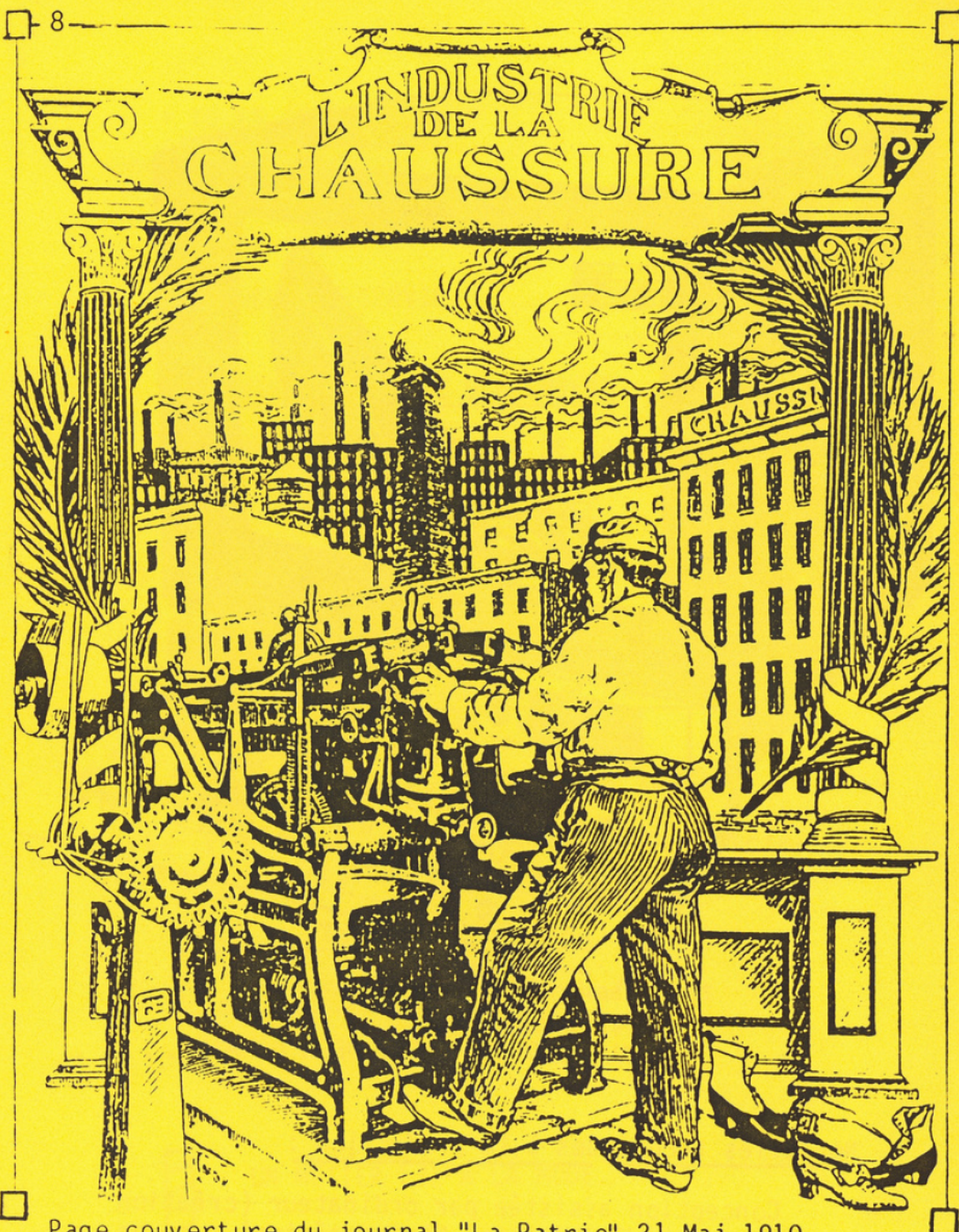
Page couverture du journal "La Patrie" 21 Mai 1910