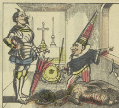
Et l'engagea à prendre les armes pour délivrer le royaume de Craquinsas, dont venait de le déposséder le terrible général Cirimikoko.