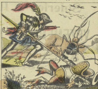
En passant sur le corps du sorcier Grenouillard, de l'état-major de Cirimikoko.