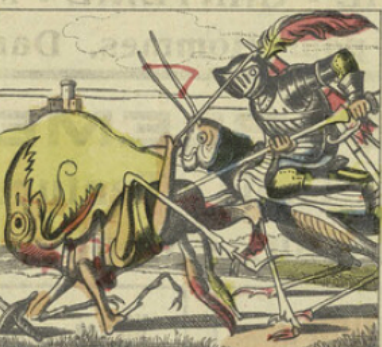
Grâce à l'allure rapide de Caracole, il parvint à rejoindre Cirimikoko qui s'était enfui des premiers et lui fit mordre la poussière.