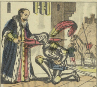
Armé chevalier et ayant juré sur le grand parapluie de se montrer digne de cette distinction, il annonça son départ pour Craquinsas.