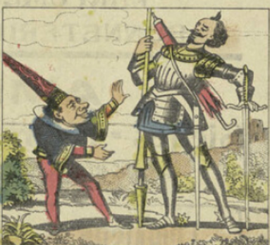
A la suite de cette éclatante victoire, Microcambo, rentré en possession de ses états, donna au beau Solérol sa fille en mariage et le proclama son premier ministre.