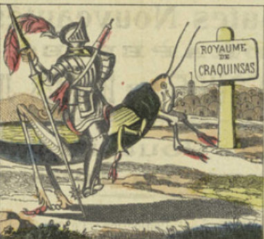
Monté sur Caracole, le beau Solérol franchit la frontière du royaume de Craquinsas,