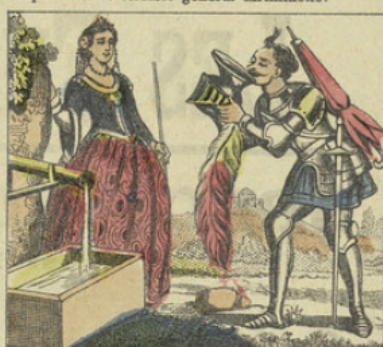
Comme il s'était échauffé dans la lutte, il s'approcha d'une fontaine voisine pour se désaltérer. La fée de la source lui apparut,