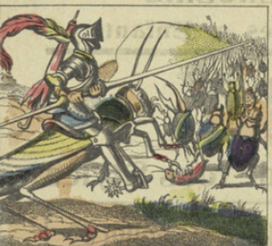
Il ne tarda pas à rencontrer l'armée ennemie. Il en fit un affreux carnage et poursuivit les fuyards.