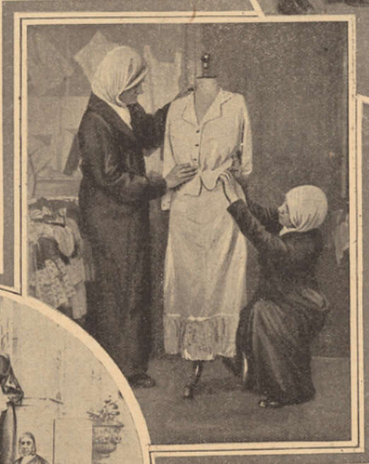
Toutes les tendances de la Turquie nouvelle se trouvent réunies dans ces photos. Jadis oisive et délaissée, la femme turque de demain sera familiarisée avec les sciences, et le costume porté durant des siècles sera remplacé par la robe occidentale que confectionnent ces jeunes filles. A gauche, la sortie d'un lycée de jeunes filles; celles-ci ont encore la face voilée, mais, de plus en plus, cette coutume elle-même disparaît.

de la résurrection nationale, l'enseignement féminin, en Turquie, était beaucoup moins avancé que l'enseignement masculin. L'une des grandes préoccupations des nouveaux maîtres de la Turquie a été justement de l'organiser. Une loi de 1918 prévoyait la création, dans toutes les villes importantes, d'écoles moyennes pour les filles. Ces écoles moyennes existent aujourd'hui. Dans ces écoles, les jeunes filles de douze à seize ans suivent des programmes qui correspondent assez bien à ceux de notre enseignement primaire supérieur.