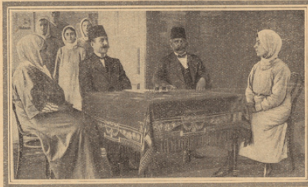
Une jeune fille turque passant son brevet.

L'une de ces vaillantes, Halide Edib Hanoum, femme de lettres et journaliste, qui, sous le règne même du Sultan rouge, menait une ardente campagne en faveur des libertés nationales, s'est acquise une célébrité toute particulière.