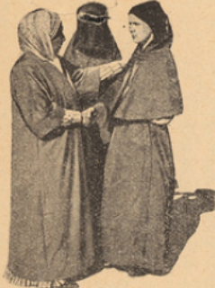
La directrice d'un lycée ture de jeunes filles et l'une de ses élèves.

poétesse de talent, fait de même. Et nombreuses sont les dames turques qui participent, de la manière la plus active, à la vie publique de leur pays.