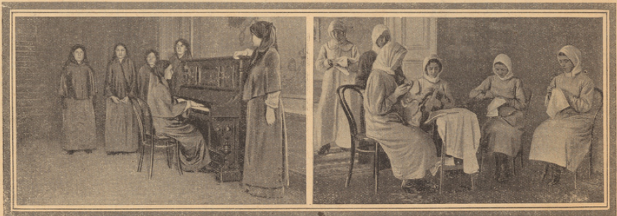
Les photos de cette page ont été prises dans une école normale où l'on instruit des jeunes filles turques qui, après avoir passé de sérieux examens, iront dans toutes les agglomérations de la Turquie pour enseigner dans les écoles. On en fait des jeunes filles cultivées, à qui l'on donne des notions de musique et qui seront aptes à faire des travaux de couture.