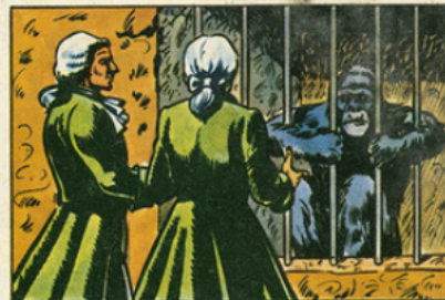
Sous Louis XV, Buffon fait, dans son Histoire naturelle , la première description du monde des singes.