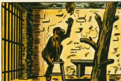
Vers 1920 enfin, l'Allemand Kohler étudie l'intelligence des chimpanzés en leur posant des « problèmes ».