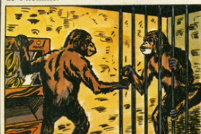
Un singe de Yerkes remet un jeton à un compagnon. Avec ce jeton, l'autre pourra obtenir une banane dans un distributeur !