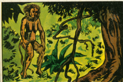
Autrefois, on n'avait pas une idée bien précise de ce que sont les singes. (Cette image-ci date de l'époque du roi Henri IV.)