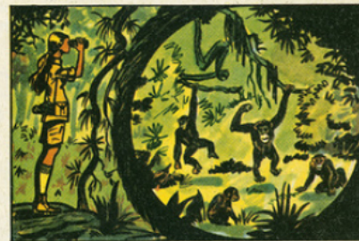
Depuis 1960, Jane van Lawick étudie les meurs des singes en liberté, dans leur habitat naturel.