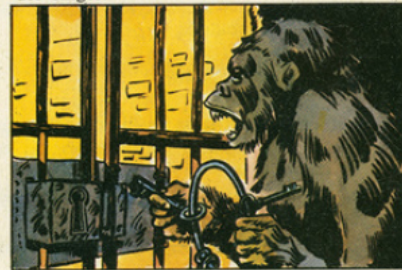
L'Américain Yerkes continue ces expériences montrant l'habileté des singes.