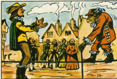
A l'époque de Louis XIV, le singe Fagotin est un personnage des plus connus.