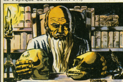
Un grand savant, Charles Darwin (1809-1882), se demande si le singe ne serait pas l'ancêtre de l'homme.