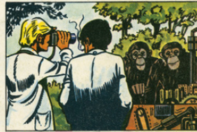
A l'institut Yerkes, aux Etats-Unis des singes vivent en liberté: ils sont étudiés par les savants.