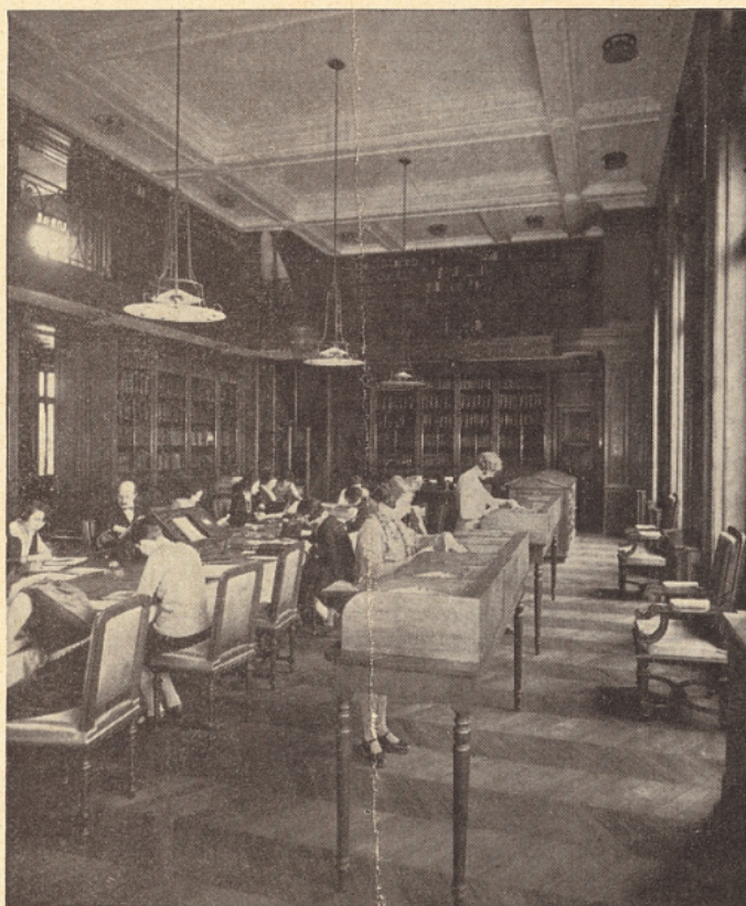
Travail personnel des élèves à la Bibliothèque de la Chambre de Commerce

Elle a mis, en conséquence, tous ses soins à l'organisation des cours de gymnastique. Ceux-ci, ont lieu l'hiver, dans une salle chauffée, et, dès la belle saison, en plein air, dans un stade situé aux portes de Paris.