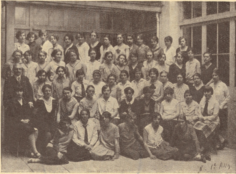
Une récente promotion

vées, soit de pouvoir, éventuellement, gérer elles-mêmes leur fortune.