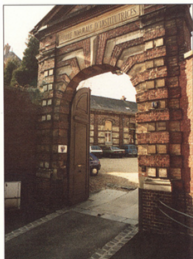
Site : Rouen, rue de Lille

Rappelant que "... l'École est au service des élèves et des étudiants" cette loi insiste sur la nécessité de placer "l'élève au centre du système éduca-