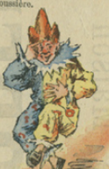
Jules a une idée.