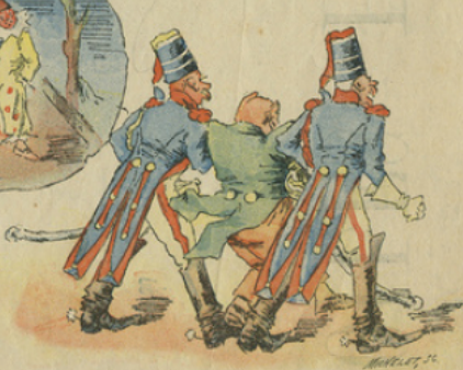
Il a beau protester. Il est emmené comme trouvé en état d'ivresse sur la voie publique. On lui appliquera la loi.