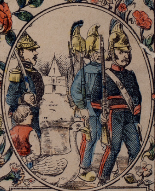
Défilé devant M. le Maire