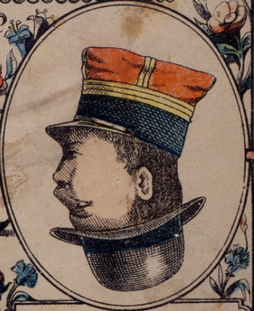
Deux Messieurs bien coiffés