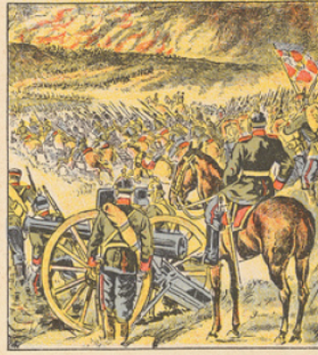
En Belgique les armées allemandes continuent à détruire tout ce qu'elles rencontrent sur leur route et pourrissent sous la mitraille leur marche sur la France. L'armée belge a essayé ce mouvement dans la mesure où la décision et le courage pouvaient suppléer à la force. Cependant la marche des barbares progressa, malgré les pertes effroyables qui leur sont infligées. Namur est investi. Le 22 Août une violente bataille s'engage à Charleroi. Français et Belges se disputent la possession de cette ville; la supériorité numérique des troupes allemandes a malheureusement raison de la bravoure française.