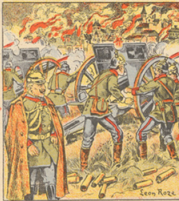
La ville de Louvain qui comptait 45.000 habitants et qui fut la métropole intellectuelle des Pays-Bas depuis le quinzième siècle, n'est plus aujourd'hui qu'un monceau de cendres. Les Allemands, le 26 Août, venaient d'éprouver un échec et se repliaient en désordre sur Louvain. Les soldats, qui gardaient la ville, les accueillirent, par suite d'une erreur, à coups de fusil. Ils prétendirent alors que les coups de feu avaient été tirés par les habitants et, sans écouter leurs protestations, ils décidèrent sur le champ de détruire la ville. Plusieurs notables furent fusillés et, quelques heures plus tard les « tanks », à l'aide de grenades incendiaires mettaient le feu à Louvain.