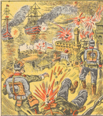
En raison des traités d'alliance qui l'attachent à l'Angleterre, le Japon a déclaré la guerre à l'Allemagne le 23 Août. La déclaration de guerre avait été précédée par l'envoi, le 25 Août, d'un ultimatum au gouvernement allemand, le sommant de retirer ses troupes japonaises et chinoises des territoires de guerre ou de les désarmer et d'évacuer le territoire du protectorat de Kiau Tchou. L'Allemagne n'ayant pas répondu à cet ultimatum, une escadre japonaise a commencé le 24 Août le bombardement de Tsing-Tao qui défend l'entrée de la baie de Kiau Tchou.