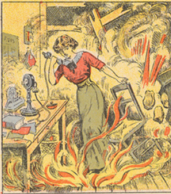
La petite ville d'Etain était bombardée le mardi 25 Août à 4 heures du matin. Le bureau de poste était assailli à la garde d'une jeune employée qui stoïquement était devenue à son poste. Pendant que les obus pleuvaient sur la ville, elle téléphonait à Verdun pour faire compie de ce qui se passait. Le directeur des postes de Verdun était en train d'écouter cette courageuse jeune fille lorsque, tout à coup, celle-ci s'interrompit et cria : « Une bombe vient de tomber dans le bureau ». Et tout rentra dans le silence.

La téléphoniste d'Etain. Les cigognes en Provence. Bataille de Charleroi. - Les japonais bombardent Tsing-Tao. - Exode des populations Belges. - La marche des Russes Destruction de Louvain. - Constitution du ministère de défense nationale. - Le général Gallieni.