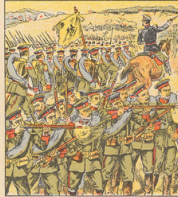
Les succès remportés par l'armée russe en Prusse orientale produisent en Allemagne une véritable consternation. Les combats se poursuivent avec un acharnement moeli. Le 25 Août, en présence de l'offensive vigoureuse des Russes, les forces allemandes font devant les innombrables divisions de cosaques et abandonnent toutes les fortifications qui défendent les bacs. Leur débâcle est complète. Ils laissent sur le terrain des charriots remplis de munitions et de l'artillerie qui tombent au pouvoir des Russes.