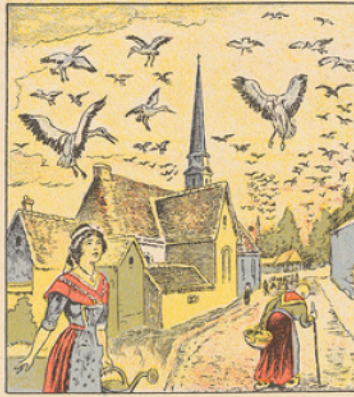
Les combats incessants qui se firent en Alsace, les obus qui éclatèrent de toutes parts, les maisons en flammes, ont rendu le séjour impossible aux cigognes qui se voient obligées d'abandonner les régions bombardées par la guerre. Ces oiseaux qui les habitants d'Alsace considéraient, venaient en grand nombre se réfugier sur les côtes de Provence où la population les accueillit comme un heureux péage.