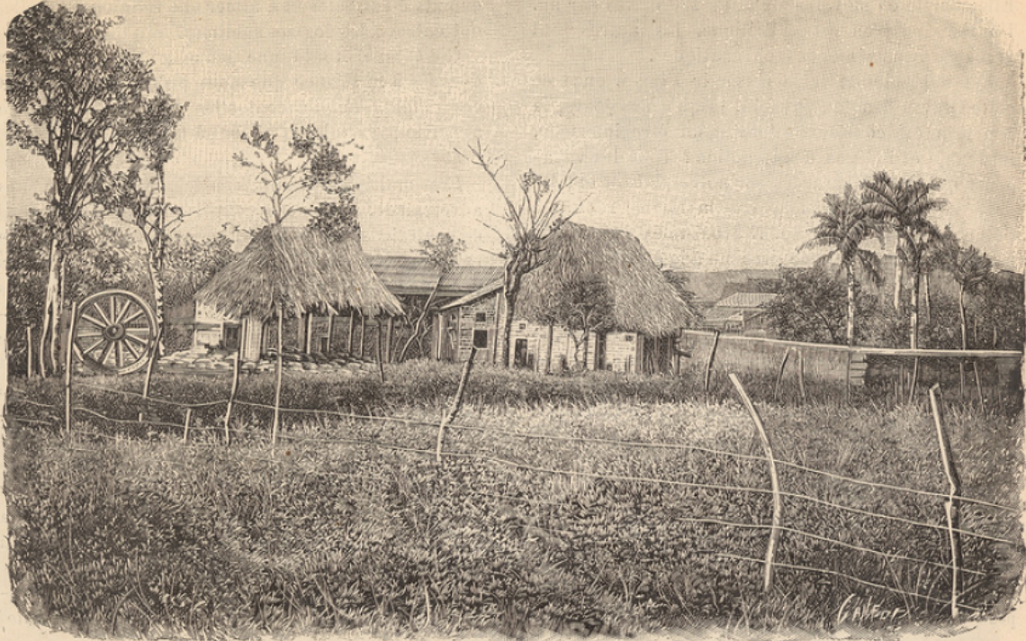
CUBA. — POLO VIEJO; d'après une photographie envoyée par un Missionnaire Dominicain (voir p. 77.)