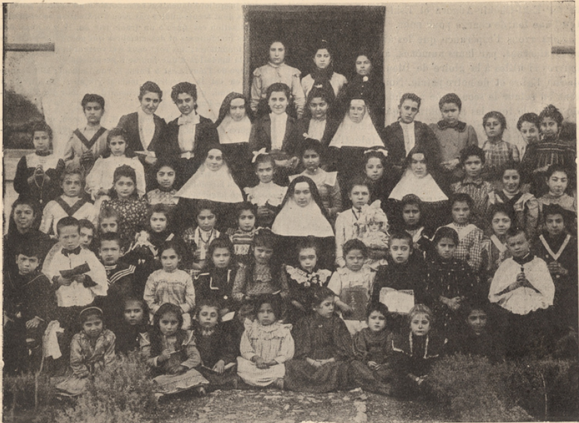
ASIE MINEURE. — GROUPE D'ENFANTS EUROPÉENS DE L'ÉCOLE DE L'IMMACULÉE-CONCEPTION D'ESKI-CHEHIR ; reproduction d'une photographie.

parce qu'elle est entretenue aux frais de la Compagnie du Chemin de fer d'Anatolie ; nous avons la douleur de voir qu'on exerce la pression la plus odieuse pour la peupler.